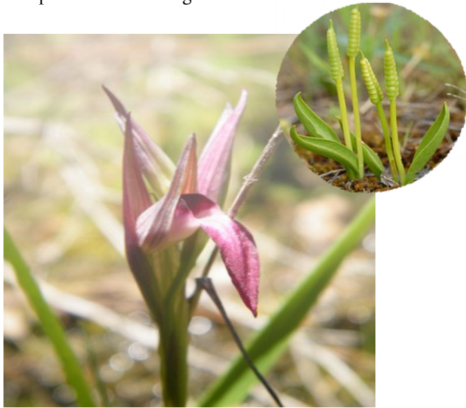
Sérapia Lingua (orchidée) et Ophioglosses des Açores (petite fougère méditerranéenne), fleurs constituant de la diversité des zones humides temporaires méditerranéennes.

Il est prévu qu'un guide soit à disposition des agents de terrain afin qu'en s'appuyant sur leurs outils de repère (bornes aux bords des routes départementales), ils puissent localiser ces zones humides et appliquer les préconisations du guide.