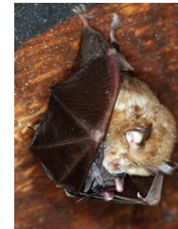
Femelle de petit Rhinolophe avec son jeune

Conventions de suivi : Suite à un contrat non agricole et un chantier bénévole, deux conventions ont été signées sur 5 ans en faveur du suivi de colonies de reproduction du Petit Rhinolophe. Les termes de la convention permettent le suivi des colonies et des échanges avec les propriétaires pour leur apporter des conseils de préservation.