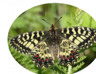
La Diane (Zerynthia polyxena)

La Diane est une espèce méditerranéenne de papillon de jour qui utilise comme plante hôte des espèces d'Aristolochie. La Diane a été découverte en 2013 et deux nouvelles observations ont été recensées lors d'une journée papillon en 2015. Sa période de vol est précoce, elle est active à partir d'avril et sa répartition est strictement liée, pour les chenilles, à la présence de leurs plantes hôtes, les aristoloches. Les zones connues pour ce papillon se situent sur la commune de Mialet.